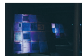
"Untitled blue", mönsterkort och stålkonstruktioner, 2019.